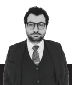
AV. ALİ DOKUZLU